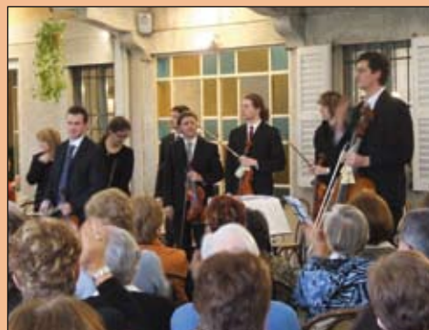
Concerto villa Buttafava 09 - 04 - 06

La piazza Libertà è una piazza di grande traffico perchè si trova all'incrocio di più strade: via Matteotti, via S. Maria, via XXIV Maggio, via IV Novembre, via V Giornate, via Del Lavoro e via Verdi. Infatti prima si chiamava Piazza Grande.