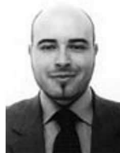
L'Assessore alle attività economiche Sicurezza e Protezione Civile Luciano Lettieri

ASSESSORE ALLE ATTIVITA' ECONOMICHE SICUREZZA E PROTEZIONE CIVILE