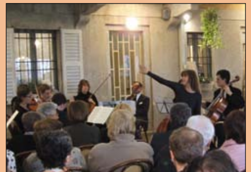
Concerto villa Buttafava 09 - 04 - 06 con figure danzate