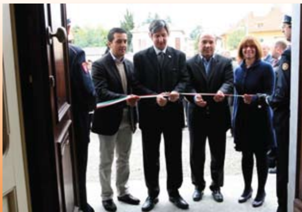
Inaugurazione mostra FRATEL VENZO

L'ingresso a tutti i concerti è gratuito.