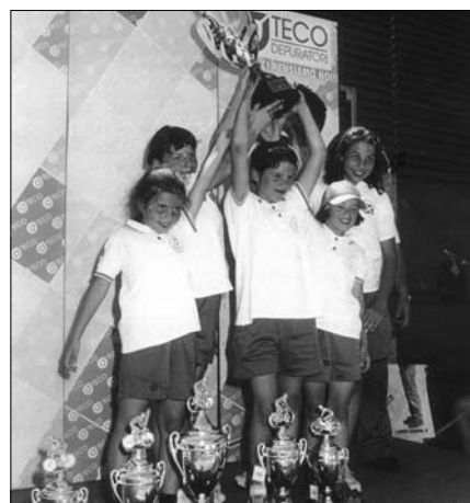
Le ragazze felici al ricevimento del premio