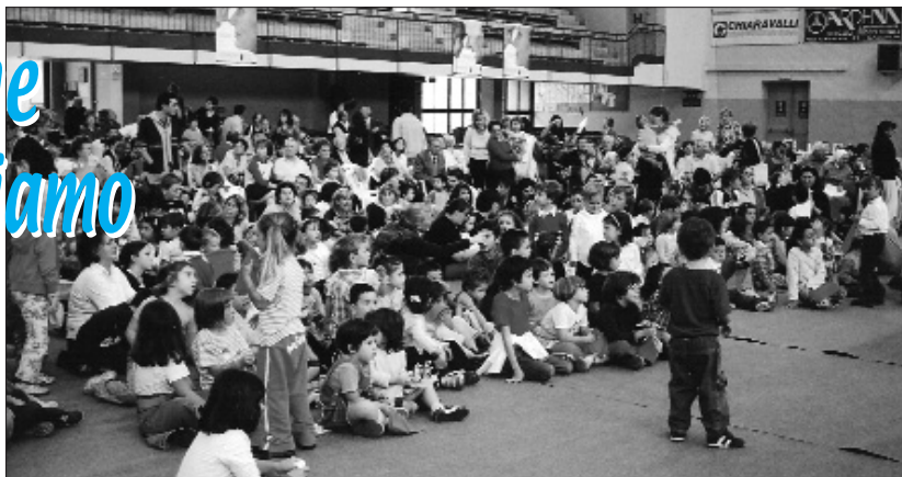
Nelle foto l'evento di sabato 2 ottobre 2004 al Palazzetto "Tacca"

“ A ppuntamento a Belleville” è il film che è stato presentato a ingresso libero, mercoledì 6 ottobre 2004 presso il Cinema Teatro Auditorio, nella rassegna dedicata alla “Festa dei nonni”. Un delizioso film d'animazione in cui la simpatica nonna affronta le situazioni più incredibili per il bene del nipote. L'originalità del disegno, fatto a mano, ha rasentato nel film l'opera d'arte col rimando alla pittura grande, alla pittura dell'impressionismo. Significative le parole del professor Angelo Croci, che ha commentato all'inizio e al termine della proiezione: «La figura del nonno è importante nella vita dei bambini perché egli è il traghettatore della memoria, colui che rappresenta il sentimento di continuità della vita. I nonni non devono frequentare troppo i nipoti, non devono sostituirsi ai genitori. Devono significare la figura della straordinarietà, del fantastico, dell'immaginario. Devono essere i donatori magici delle fiabe non mortificati dal quotidiano; coloro che accompagnano i bambini solo per alcuni tratti della loro vita regalando il dono della memoria e dell'esperienza».