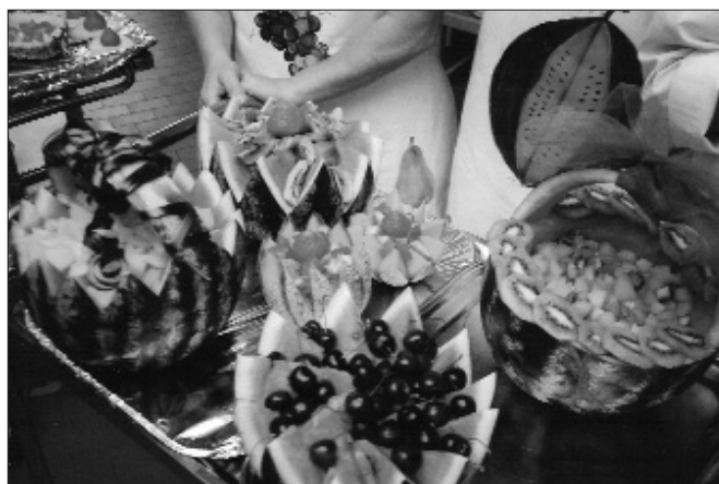
Professionalità e spirito di innovazione nelle nostre mense. Nella foto: le cuoche della Scuola materna comunale