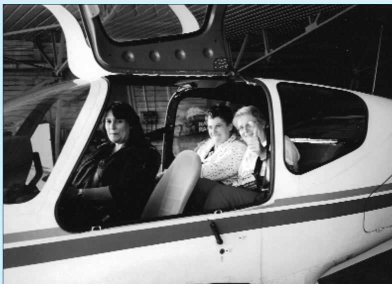
Nella foto: il... "Fiaba day", ossia un momento della giornata dedicata al "Battesimo del volo"