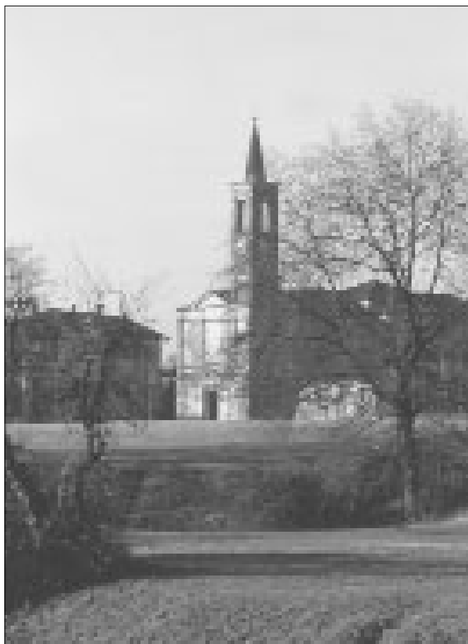
La chiesa di S. Maria del Cerro vista dal parco della Magana

Lo stacco tra pochi mesi sarà forse "doloroso", credo però, e ne sono sicuro, che l'amore per i miei cittadini sia tanto e profondo che per me sarà impossibile non frequentarli più.