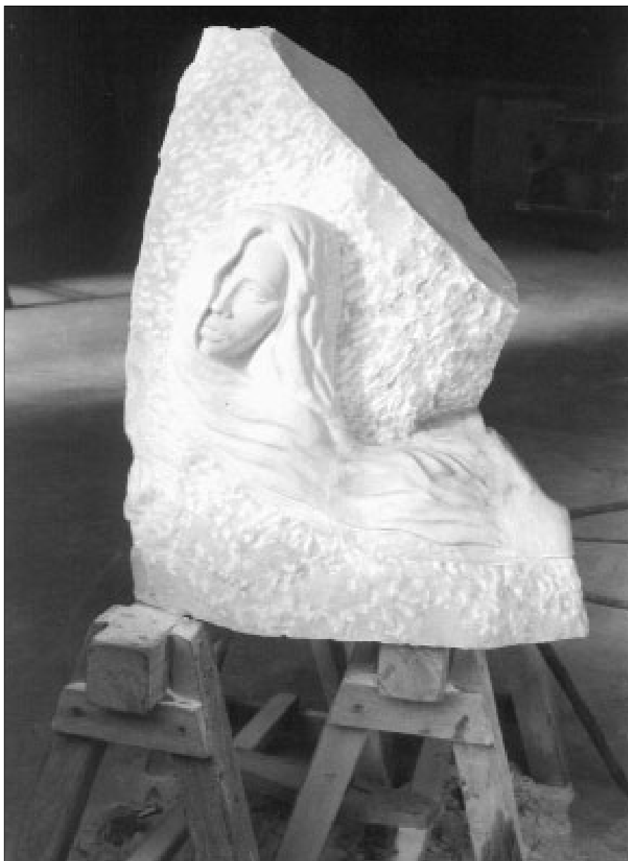
“L’alta velocità”, statua eseguita e donata al Comune dal cassanese Gaetano Martucci