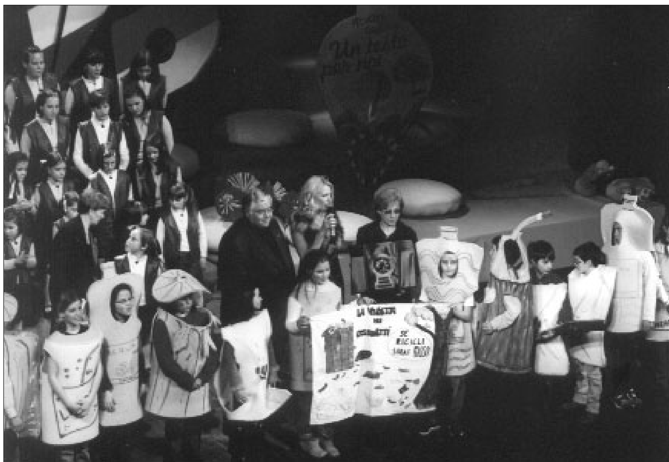
La rappresentazione della “Vendetta dei cassonetti”

U n Teatro Sociale bellissimo e affollatissimo ha accolto, il 10 febbraio scorso, la sesta edizione del concorso musicale “Un testo per noi”, organizzato dal coro “Piccole Colonne” di Trento.