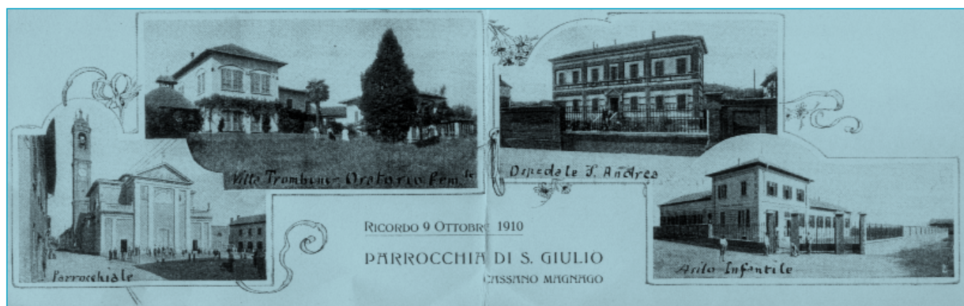
Una vecchia cartolina postale di Cassano Magnago del 1917

N ata in Austria nel 1869 e adottata in Italia nel 1874, la “cartolina postale” fu ideata per spedire a tassa ridotta la breve corrispondenza “aperta”. Era un cartoncino di formato piccolo (cm. 12,5 x 8,5), presentava in alto a sinistra l'impronta del francobollo con l'effigie del Re Vittorio Emanuele II, mentre un cerchietto sul lato destro era riservato all'annullo postale, allo scopo di non deturpare, col timbro, l'immagine del Re.