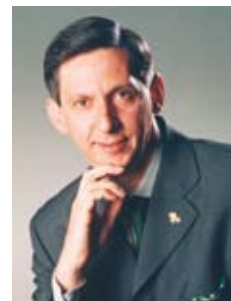
Il Sindaco Aldo Morniroli

Al Sindaco di San Pio delle Camere, e a tutti i suoi cittadini, inoltre la mia personale solidarietà, quello dell'Amministrazione, ma anche quella di tutti i cittadini cassanesi, colpiti moralmente da questo evento tragico.